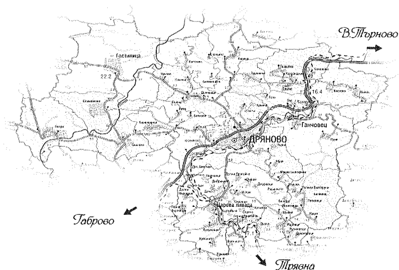
Фигура 1. Населени места в Община Дряново